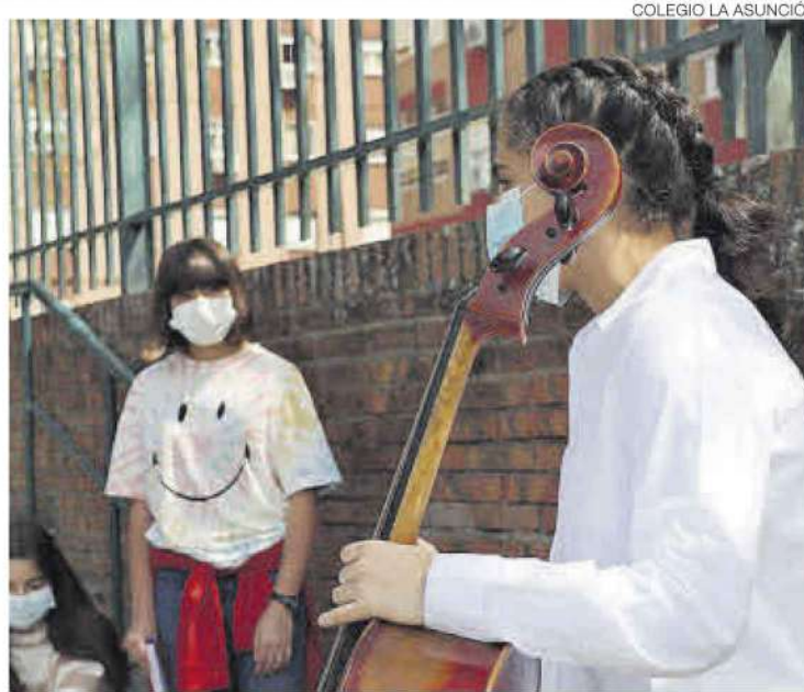
►► Actividad ► Una alumna interpreta una partitura en la yincana musical.

Durante la celebración del juego, y en un total de ocho paradas situadas en los jardines del centro, más de 200 alumnos pudieron descifrar partituras y adentrarse en la historia de diversos instrumentos, tales como el oboe, el clarinete, la guitarra, el chelo, el uke-